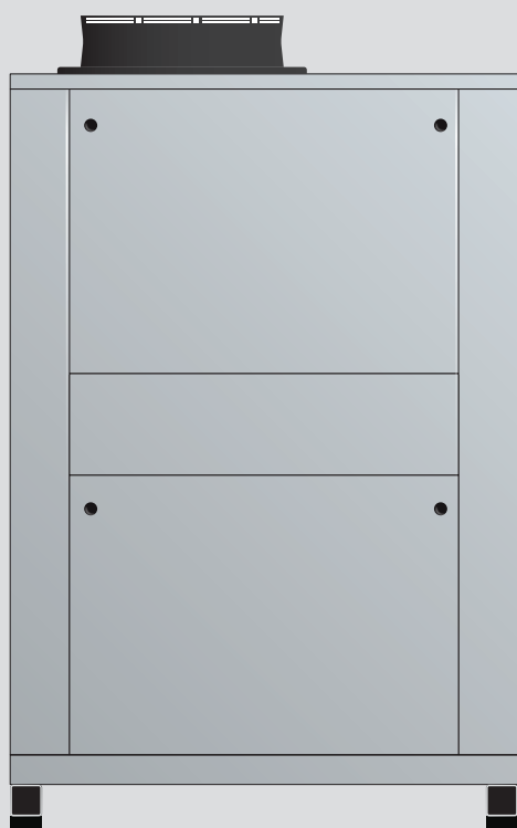
Quadro elettrico esterno con pannello di controllo